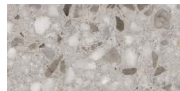
levigato / honed / geschliffen