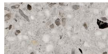
lucido / polished / poliert