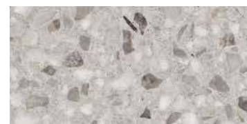
spazzolato / brushed / gebürstet